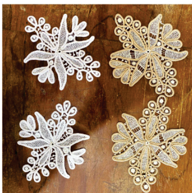
PASO3 Aplique estelar

Pontos usados: Aranha, barrete com picô, redinha e redinha com rede grande.