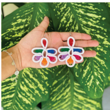
PABRI9 Brinco Vilella