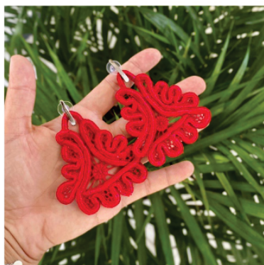
PABRI7 Brinco Isis