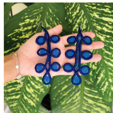
PABRI8 Brinco Luci