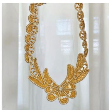
PACO5 Colar Helena

Pontos usados: Barrete com picô, rede grande com redinha