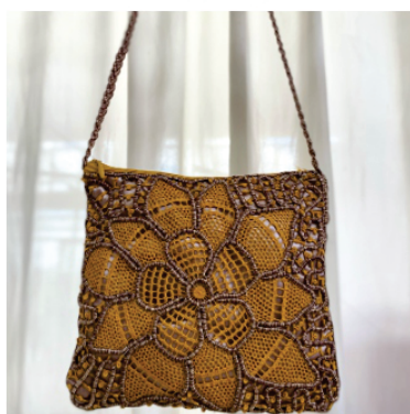
PABOL2 Bolsa Girassol

Pontos usados: Rede grande com redinha, rede grande, barrete com picô e aranha