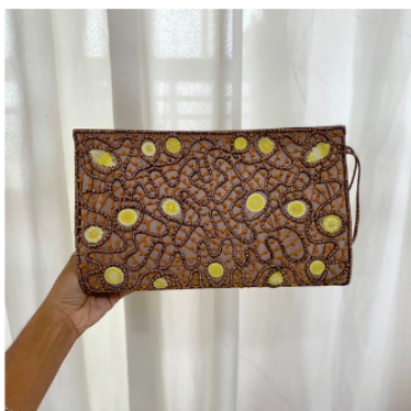
PACAR4 Carteira Amélia

Pontos usados: Aranha, aranha de cesto, aranha de parte e barrete com picô.