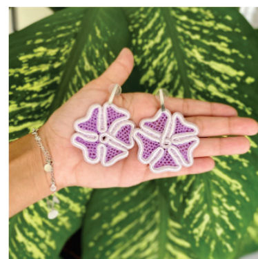
PABRI5 Brinco Ana