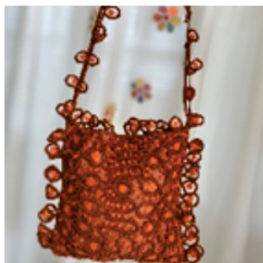
PABOL4 Bolsa caminho sem fim

Pontos usados: Aranha e barrete com picô.