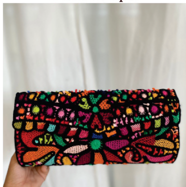
PACAR1 Carteira Bianchini

Pontos usados: Cocada, aranha, redinha e barrete com picô