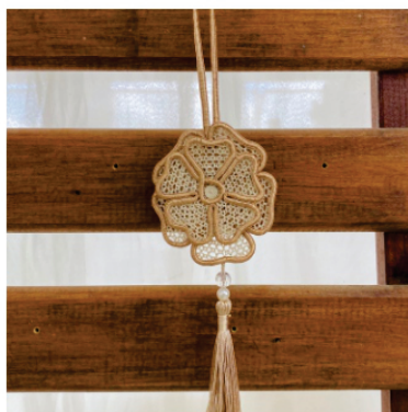
PACO2 Colar Maria