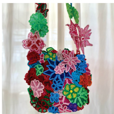
PABOL1 Bolsa Flora

Pontos usados: Rede grande com redinha, redinha, barrete com picô, cocada, caseado, aranha de cesto, linha cruzada e boca de sapo