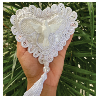
PACHA1 Chaveiro do Espírito Santo