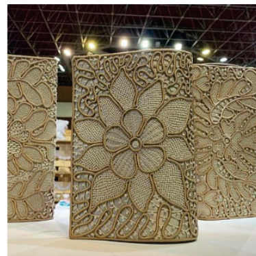
PACAR2 Carteira Asderen

Pontos usados: Aranha de cesto, rede grande, boca de sapo e barrete com picô.