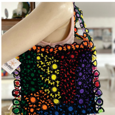
PABOL8 Bolsa Labirinto

Pontos usados: Aranha e barrete com picô.