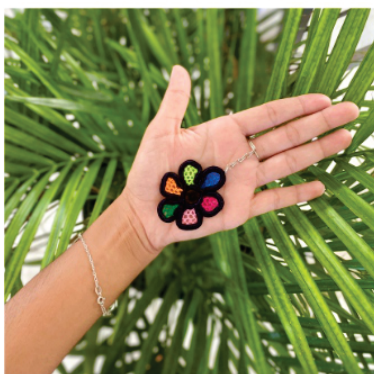
PACHA2 Chaveiro Sophia