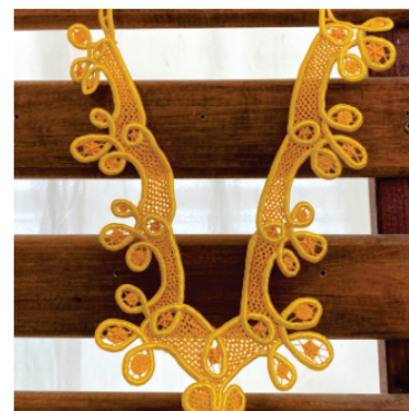
PACO3 Colar Zeza

Pontos usados: Aranha, Redinha e aranha de cesto