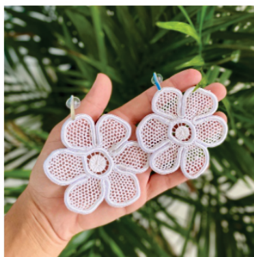
PABRI10 Brinco Camila