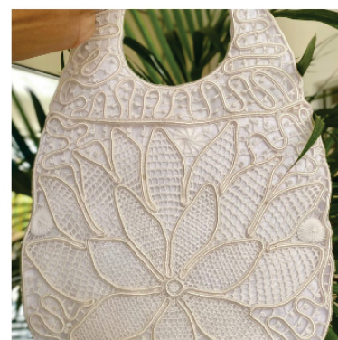
PABOL3 Bolsa Monica

Pontos usados: Rede grande, boca de sapo, aranha, aranha de cesto e barrete com picô