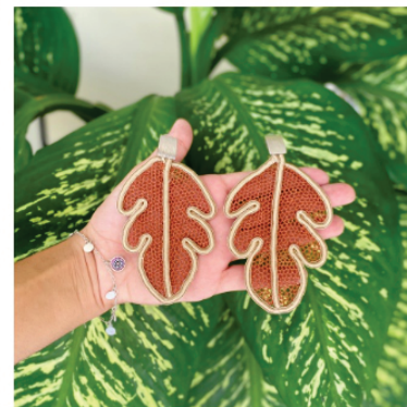
PABRI2 Brinco Palma