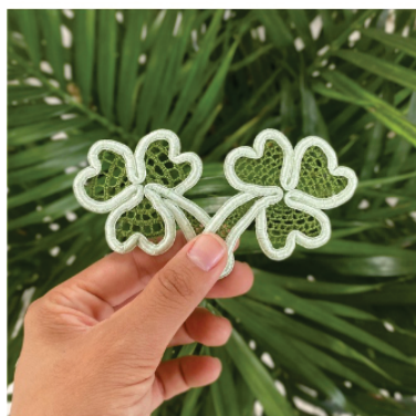
PABRO1 Broche Trevo

Pontos usados: Rede grande e boca de sapo