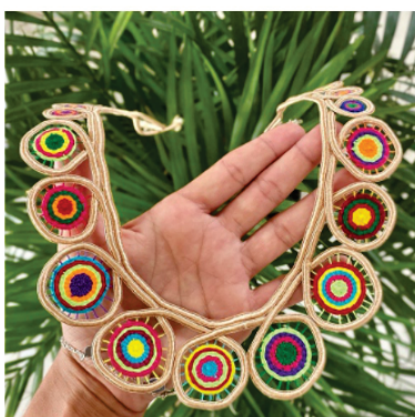
PACO4 Colar Izabel