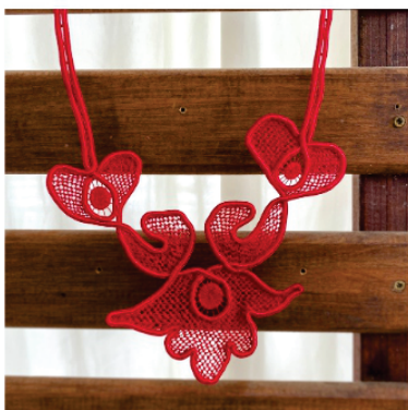
PACO1 Colar Laís