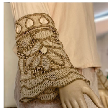
PAPUN1 Punho em Renda

Pontos usados: Aranha de duas partes, aranha de cesto, ponto redinha, sianinha, barrete com picô e boca de sapo.