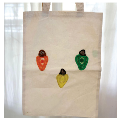
PABOL7 Ecobag Cajus