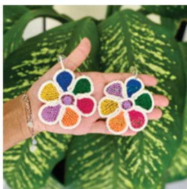
PABRI4 Brinco Folia