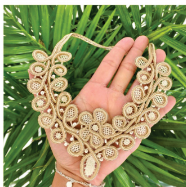
PACO7 Colar Arabesco Flor

Pontos usados: Redinha, aranha de partes, aranha e barrete com picô