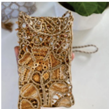
PAPOR1 Porta Celular

Pontos usados: Ilhós, aranha, rede grande com redinha e barrete com picô.