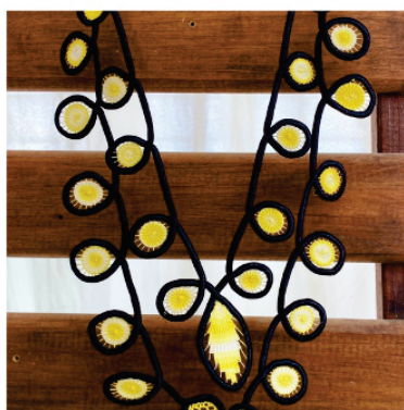
PACO8 Colar Fatima

Pontos usados: Boca de sapo, aranha de partes, aranha e aranha de cesto.