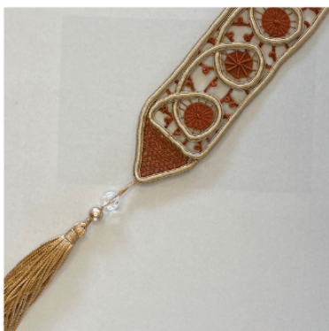
PAMAR1 Marca Páginas Mada

Pontos usados: Aranha, aranha de cesto e barrete com picô vem com franjinha e perola