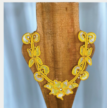
PACO12 Colar Lúcia