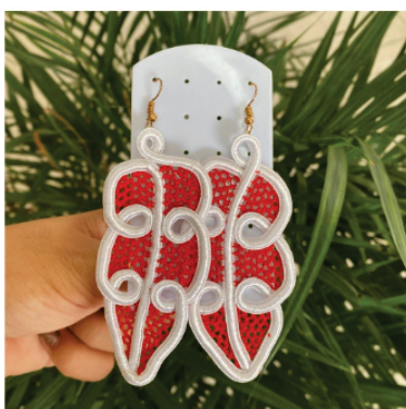
PABRI3 Brinco Folha