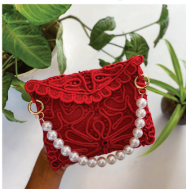
PABOL5 Bolsa Ilka

Pontos usados: Redinha e barrete com picô