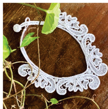
PACO9 Colar Vânia

Pontos usados: Aranha de cesto, redinha, rede grande com redinha, aranha e barrete com picô.