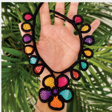
PACO10 Colar Ticy