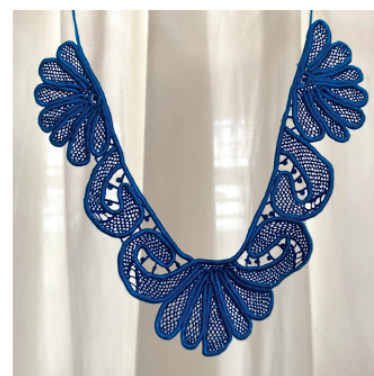
PACO6 Colar Veronica

Pontos usados: Redinha, barrete com picô, aranha e rede grande com redinha