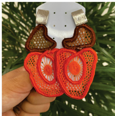
PABRI1 Brinco Caju