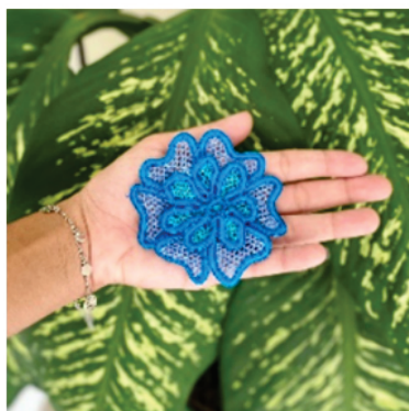
PAPRI1 Presilha Lucinha