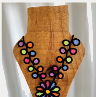
PACO14 Colar Triz

Pontos usados: Aranha e ponto com vassourinha.