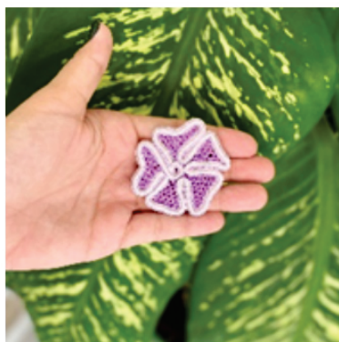
PABRO2 Broche Áster