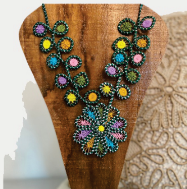
PACO11 Colar Clara

Pontos usados: Aranha e ponto com vassourinha.