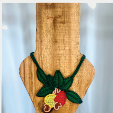
PACO13 Colar Caju tradicional